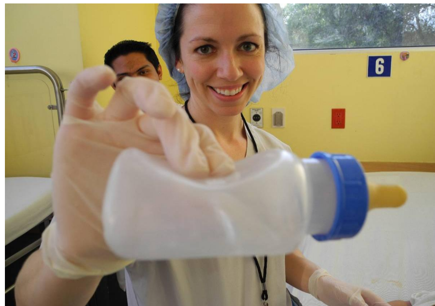
La manera incorrecta