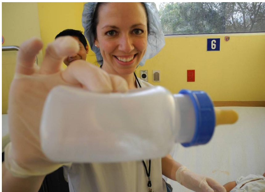
La manera correcta